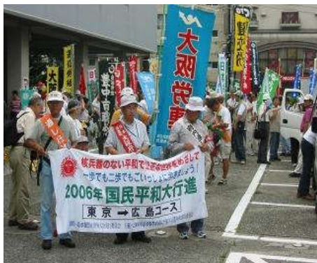
2006年平和大行進の市役所前