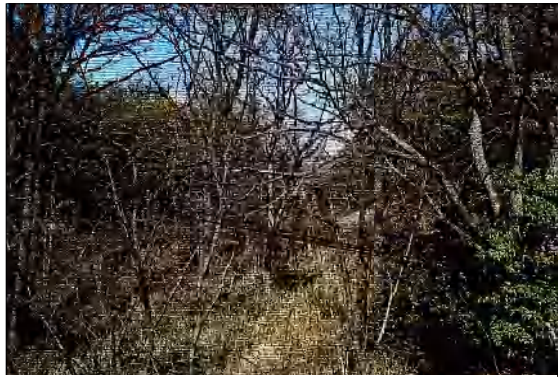
左 玉坂山 右 待兼山

「撰津名所図会」では山を越えた近村の男女の恋物語として書かれているが、いづれも想像の域を出ない。