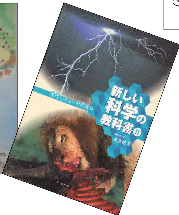
(右) 旧版となる中学校用本