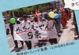
ことしも みんな きてね！ 昨年のパレード風景 (2008年5月3日)

今年も同じ時間に、同じ ルートで歩きます。 パレード初体験の人も 大歓迎。風船を手に、 シャボン玉を飛ばしな がら、みんなで楽しく歩 きましょう！